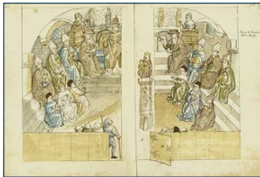
Konzilssitzung im Münster Ulrich Richental: Chronik des Konstanzer Konzils, Konstanzer Handschrift Rosgartenmuseum Konstanz